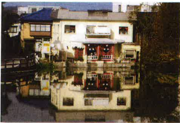
「コーヒーショップ 水映」