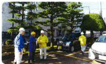
事故発生 件数の比較

今年度は傷害保険適用事故5件と増加、賠償保険適用事故2件、特に草刈り機の賠償事故(飛石)が多発しており、今一度「作業前に周囲の状況確認」「会員同士の打合わせ確認」の徹底を図り、「安全は全てに優先」を基に安全就業に努めましょう。