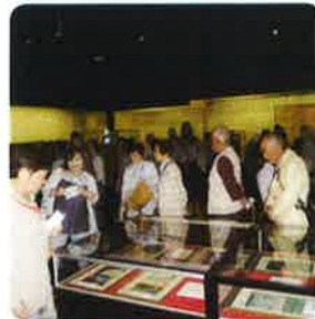
百河豚美術館にて

例年は県外話題の地を訪ねる旅でしたが、今年はゆつたりと移動の少ない近場の旅を企画しました。宇奈月温泉では周辺散策など各々好みの自由時間を過ごし、美術館めぐりでは、古代から近代の貴重な美術収蔵品がある百河豚美術館、「見る、創る、学ぶ」体験ができる富山県美術館の最新施設に感激、素晴らしい美術鑑賞が出来ました。