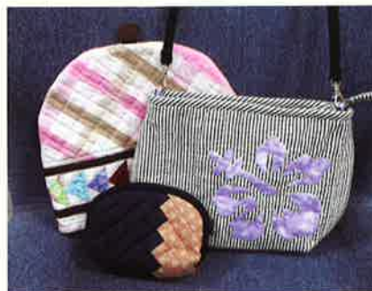
矢島 順子 (野村 B 地区)