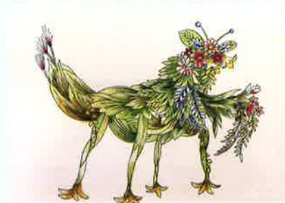
カマキリ (花と草で表現) 江幡 伸子 (西条 A 地区)