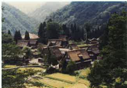
五箇山 田中 幸雄 (佐野地区)