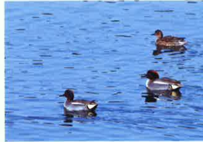
ヒドリガモ 折田 一実 (西条 B 地区)