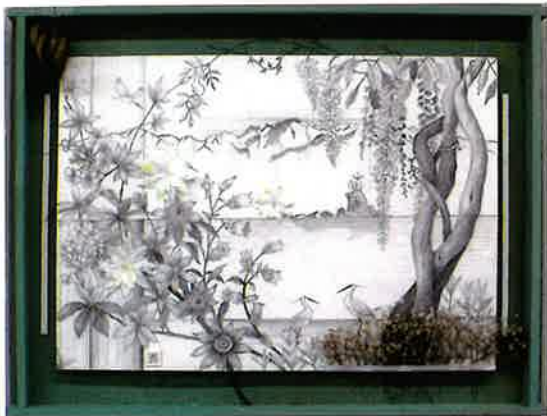
作品：春のおとずれ

コロナの為、八月は施設が休館となりましたが、再開されて、皆教室の楽しさを実感致しました。